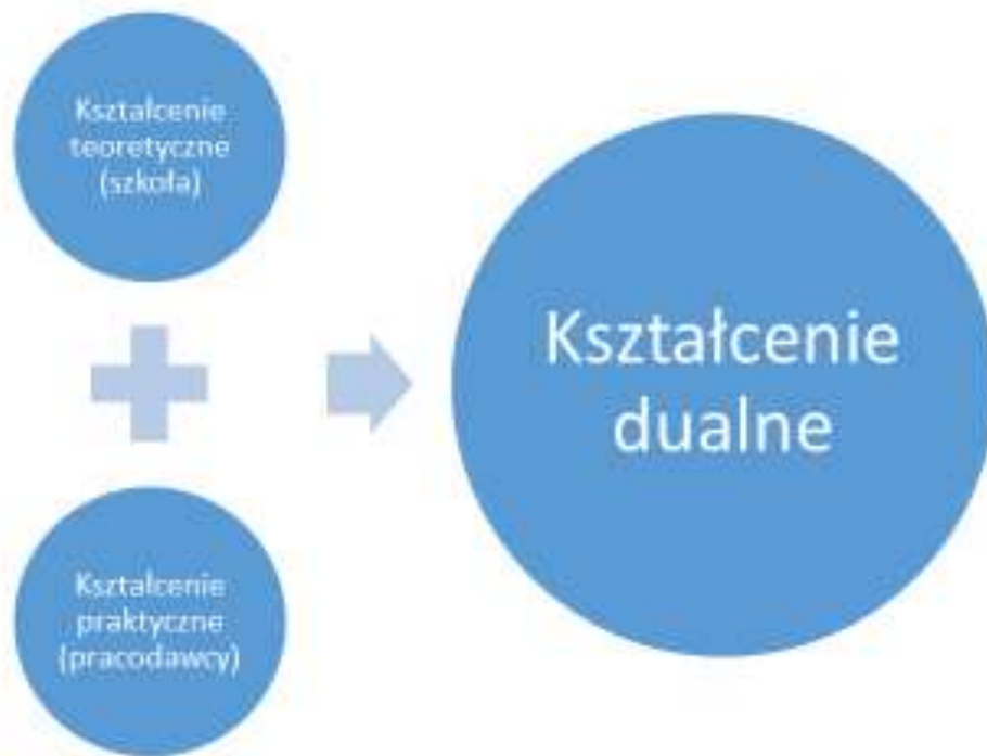
Rys. 1. Kształcenie dualne

Kształcenie dualne to połączenie kształcenia teoretycznego z kształceniem praktycznym w celu zastosowania i pogłębienia zdobytej wiedzy i umiejętności zawodowych w rzeczywistych warunkach pracy.